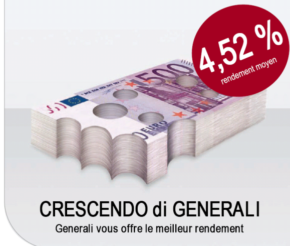
Rémunération nette globale de CRESCENDO di GENERALI

Votre argent, vous l'imaginez comme ça ?